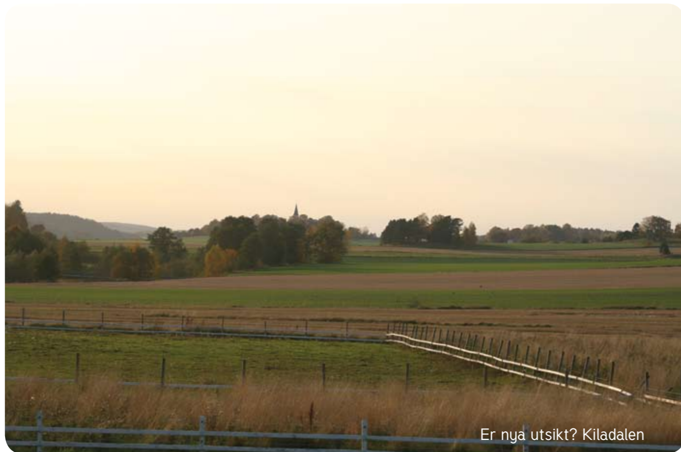
Er nya utsikt? Kiladalen